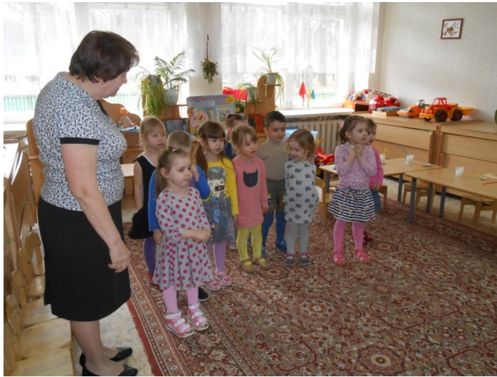
Новогодний утренник: «В гостях у мишки и зайки».